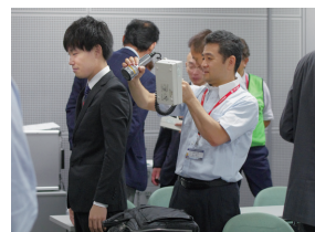
放射線サーベイ検査実習の様子(第32回 岐阜学術大会において)