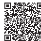
診療放射線技師基礎技術講習